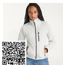
ANTARTIDA WOMAN SS6433