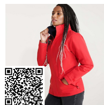
EUROPA WOMAN PK5078