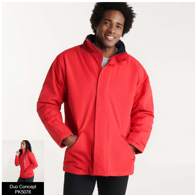
Duo Concept PK5078