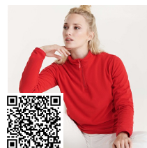
HIMALAYA WOMAN SM1096